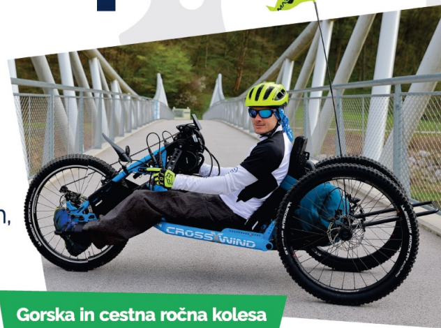
Gorska in cestna ročna kolesa

Spodbujamo kolesarjenje gibalno oviranih, omogočamo izposojlo in uporabo prilagojenih ročnih koles.